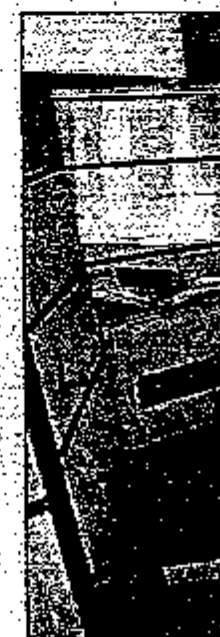
Najbolj razdino trupa visino razpihnjene k paska nartranjosti, l je v značil